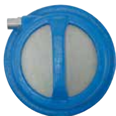
W1-20 (重量: 6.7kg) ホース接続口径: φ32