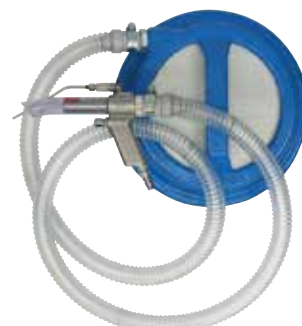
W301-II-20 (重量: 7.7kg)