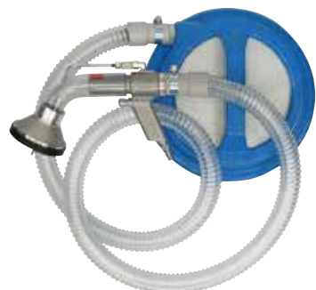
W101-YZ-20 (重量: 8.1kg)