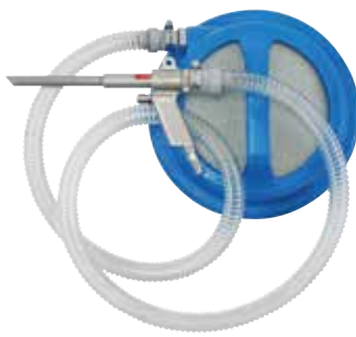
W3-20SET (重量: 7.4kg)