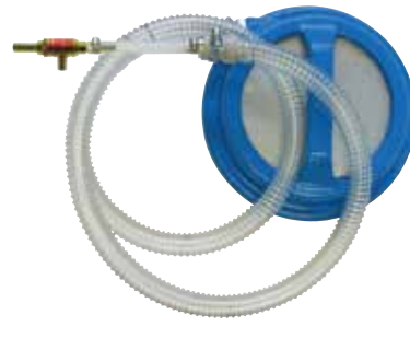
NW501-S(G)-20 (重量: 7.6kg) NW501-L(G)-20 (重量: 7.6kg)