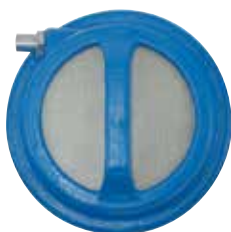
W3-20 (重量: 6.7kg) ホース接続口径: φ25